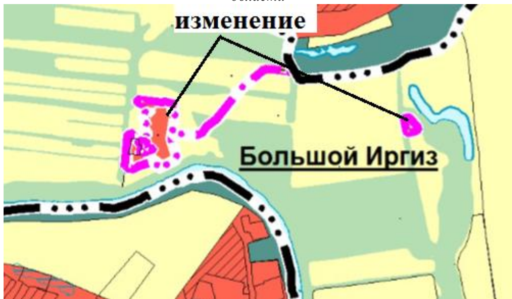
Фрагмент карты обоснования внесения изменений в генеральный план сельского поселения Малая Глушица муниципального района Большеглушицкий Самарской области